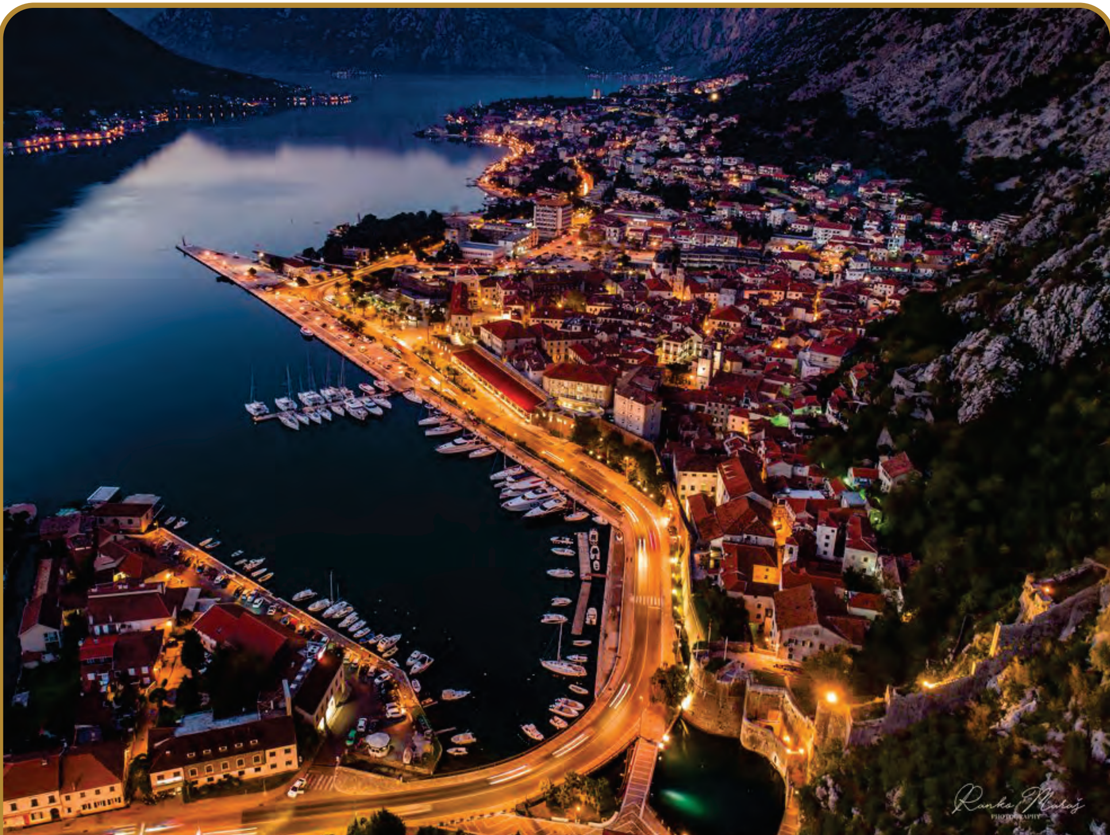
RANKO MARAŠ: Panorama Kotora noću