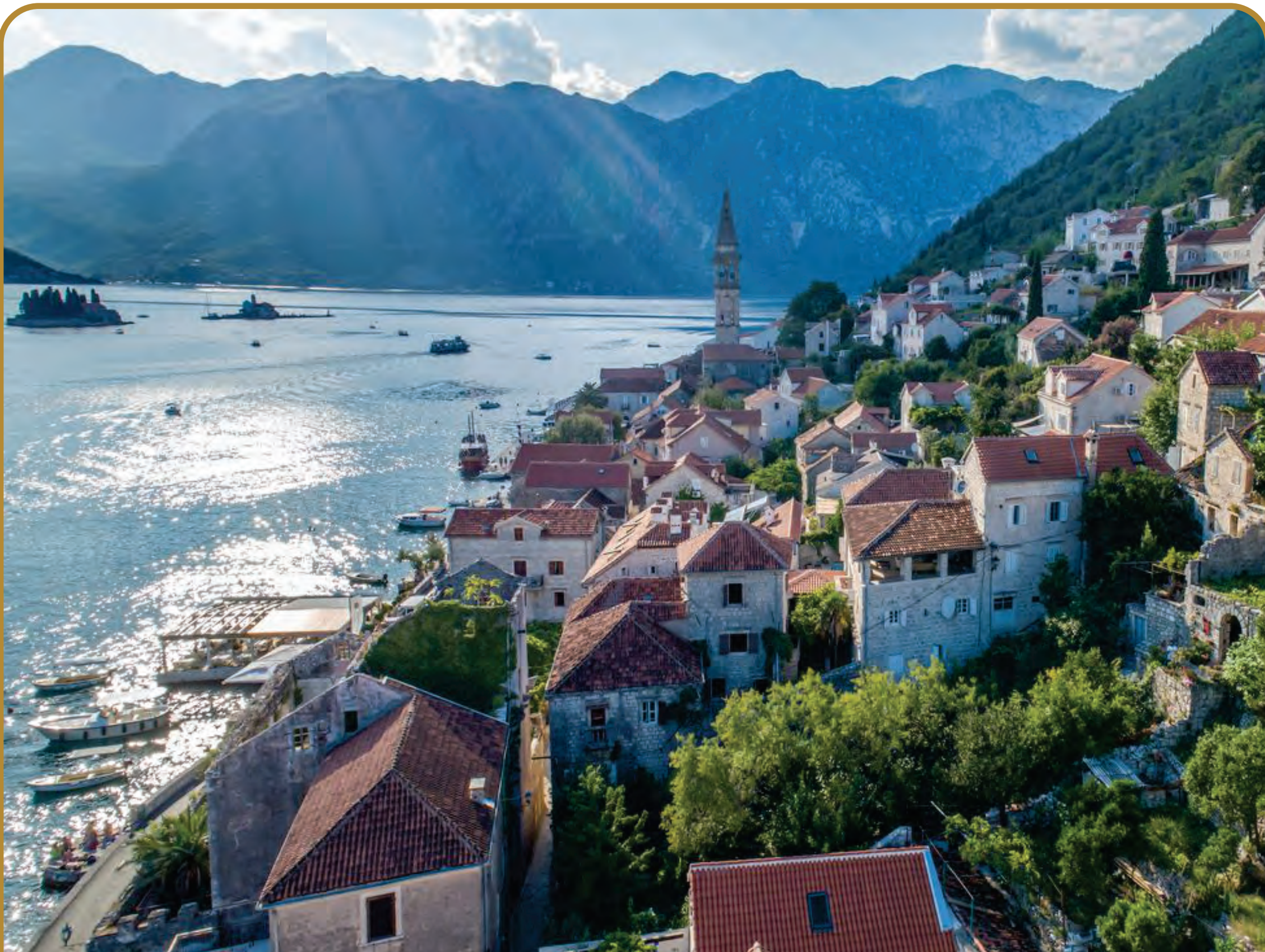
RANKO MARAŠ: Panorama Perasta