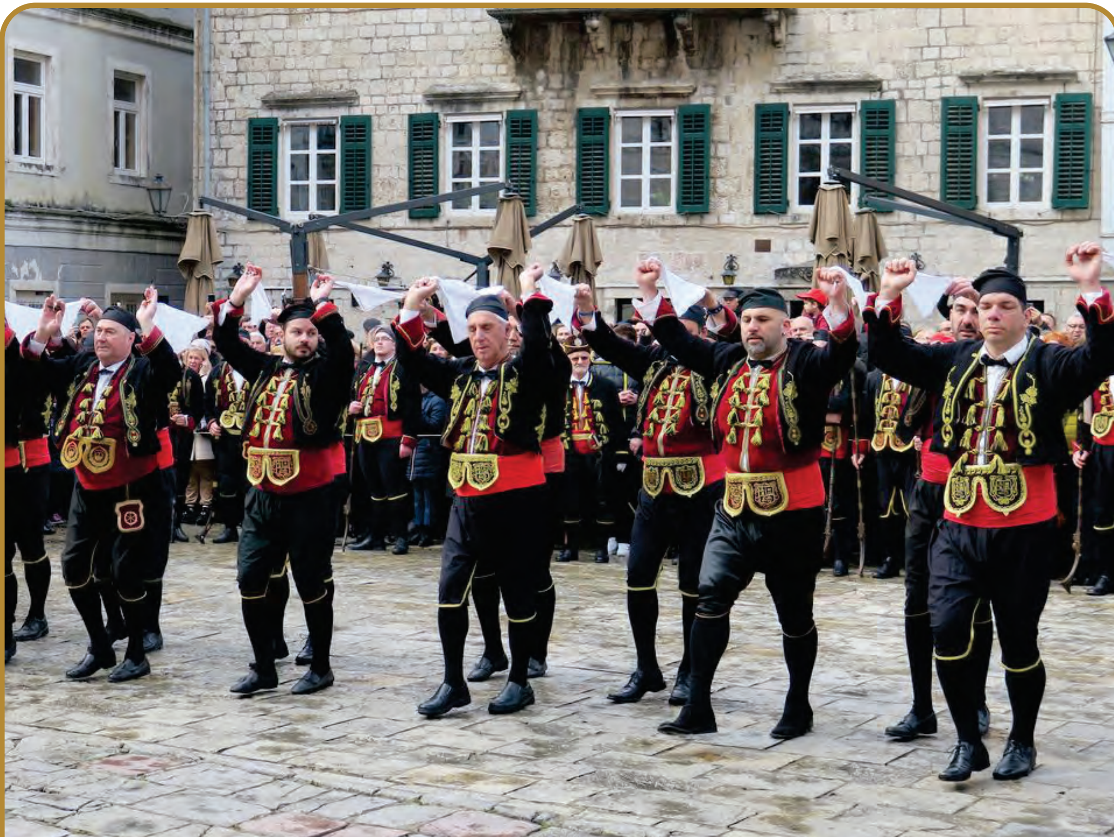
Kolo Mornarice ispred Katedrale na Vanjskoj proslavi Svetoga Tripuna (09.02.2020)