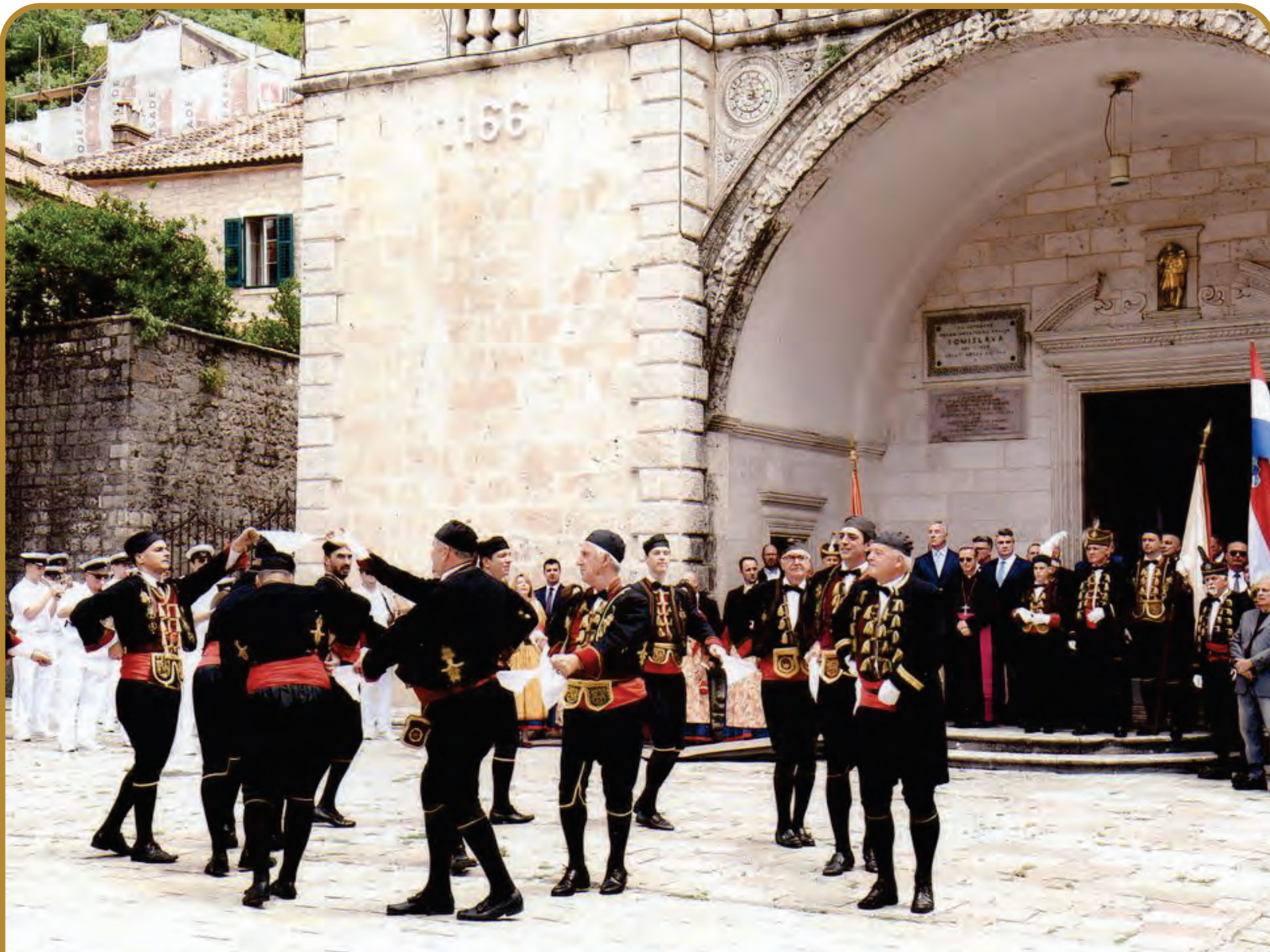
Kolo Mornarice u čast predsjednika Hrvatske ZORANA MILANOVIĆA prilikom njegove posjete Kotoru (23.06.2020)