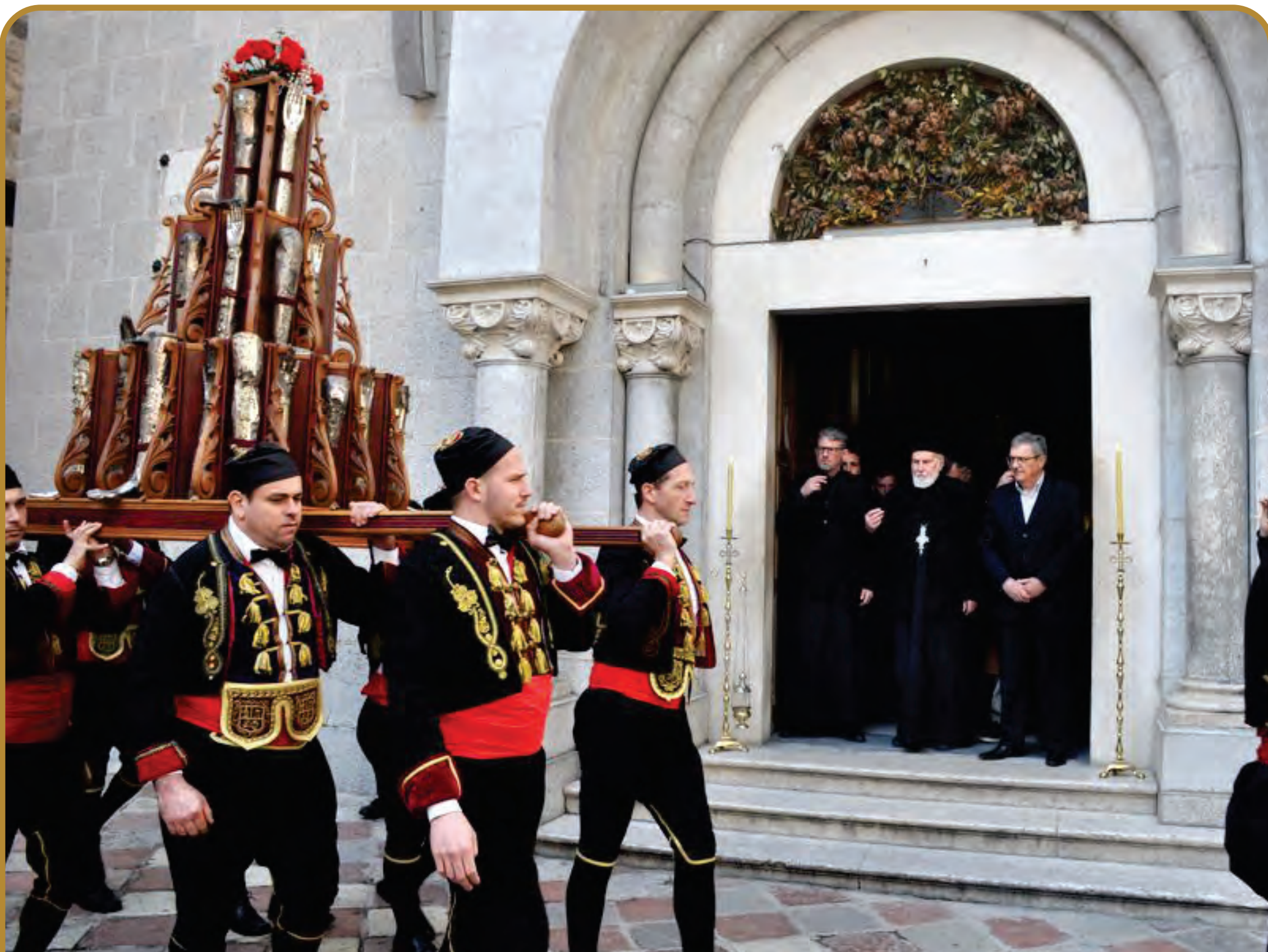
Svečana procesija pred Crkvom Svetog Nikole na Vanjskoj proslavi Svetoga Tripuna (09.02.2020)