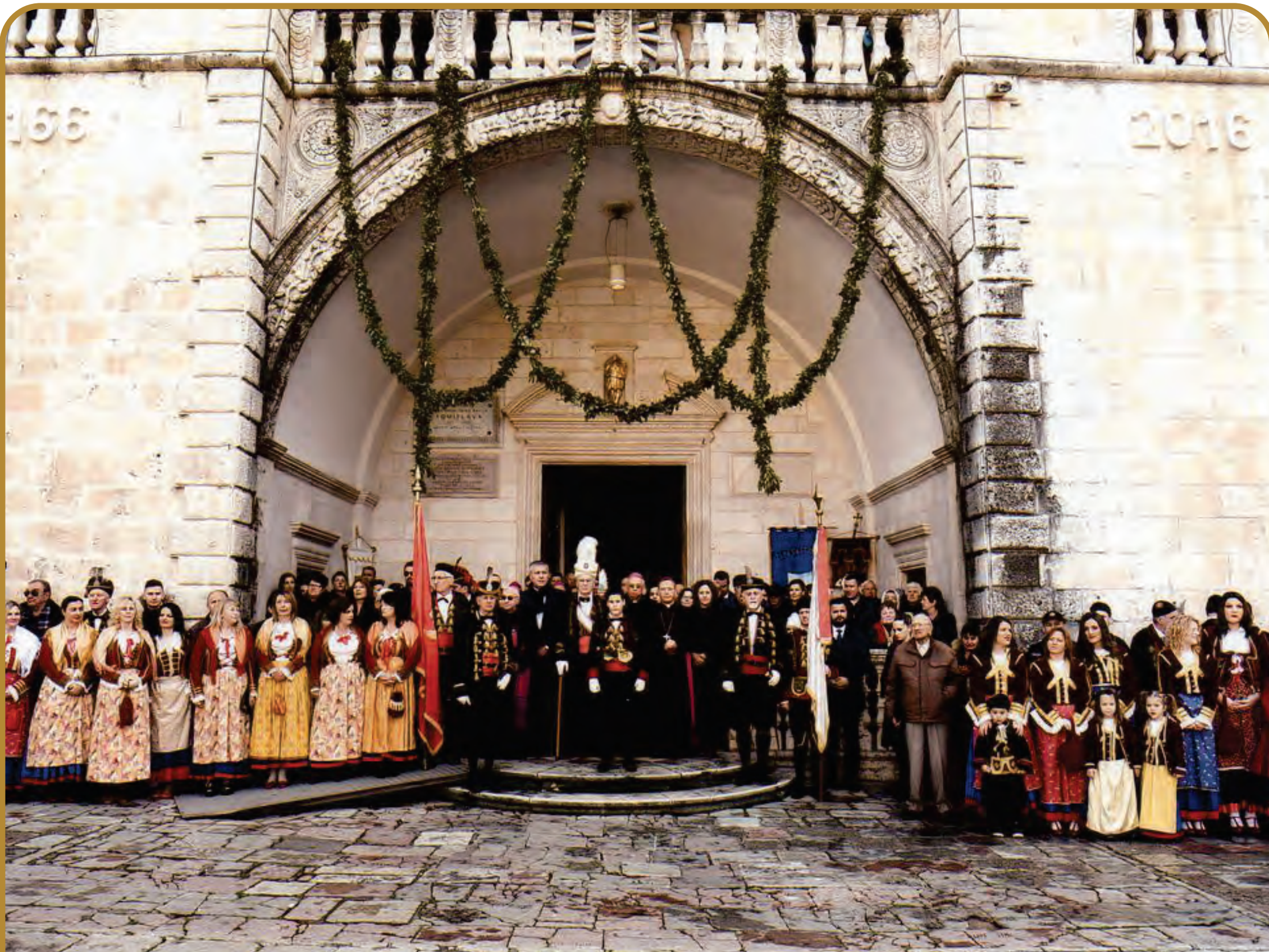
Zajednička fotografija ispred Katedrale na Vanjskoj proslavi Svetoga Tripuna (09.02.2020)