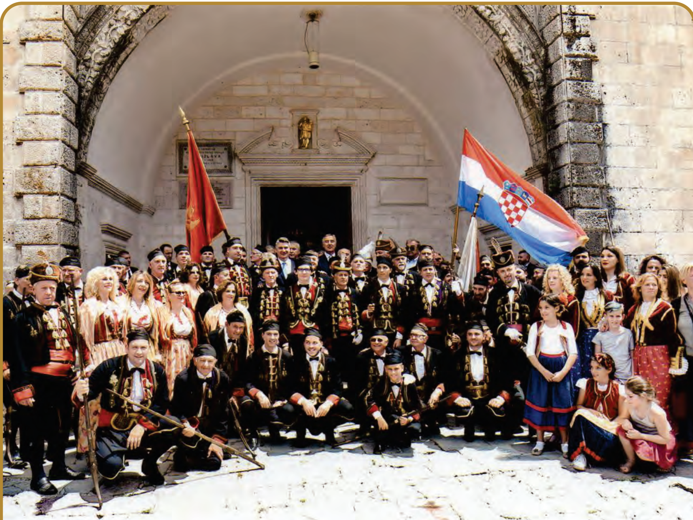
Zajednička fotografija ispred Katedrale prilikom posjete predsjednika Hrvatske ZORANA MILANOVIĆA Kotoru (23.06.2020)