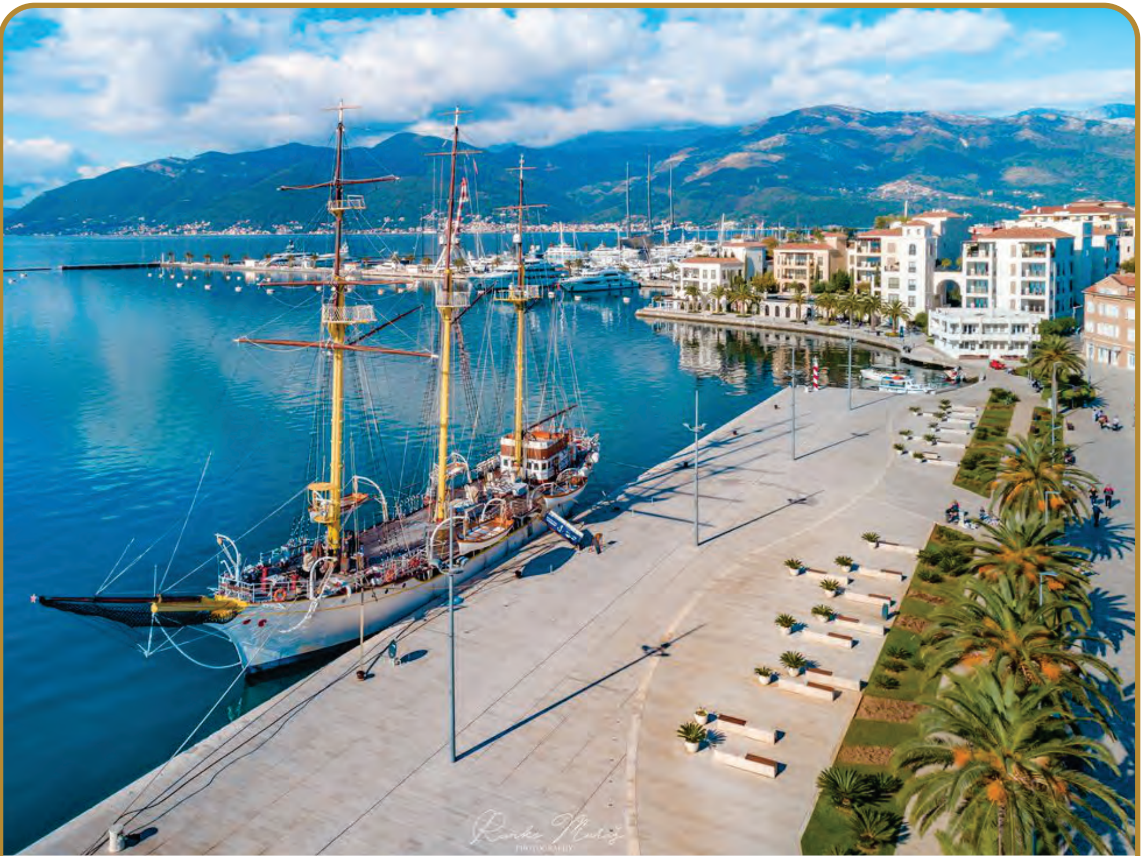
RANKO MARAŠ: Školski brod „Jadran“ na rivi Pine u Tivtu