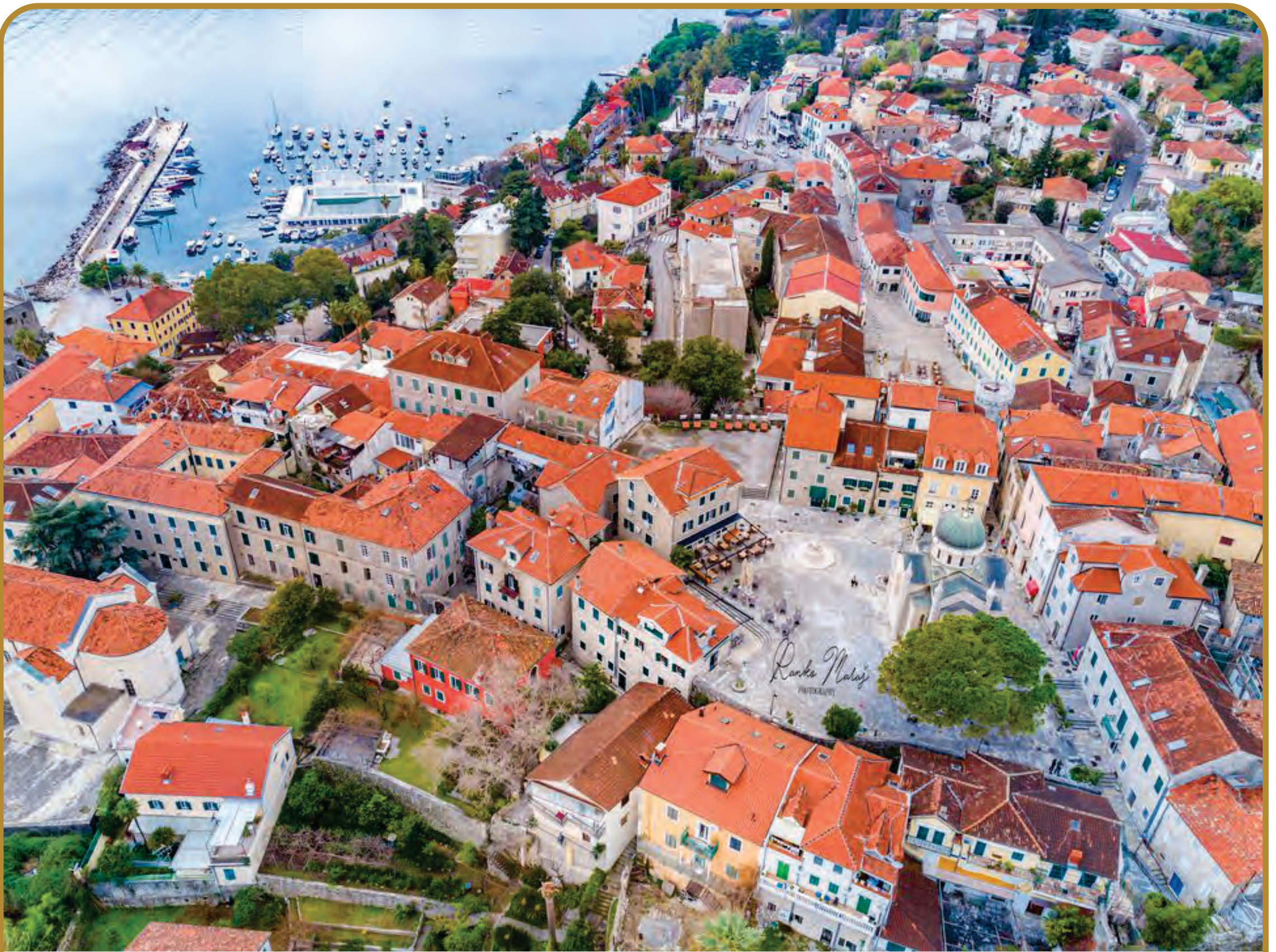
RANKO MARAŠ: Panorama Herceg Novog